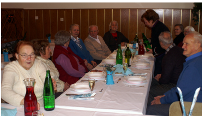
Srečanje starejših občanov