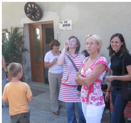
Na kmetiji Pr` Kokol