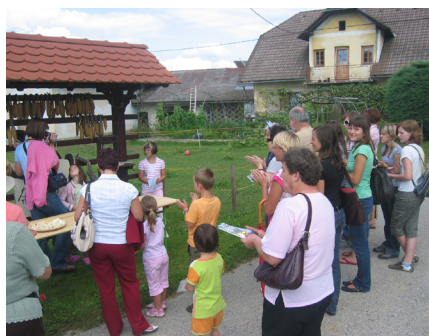
Obisk na domačiji Paternoster