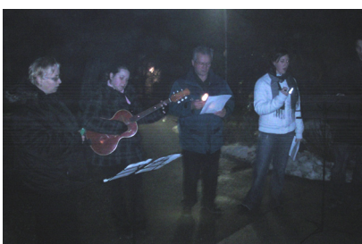
Koledniki na Gradiških Lazah