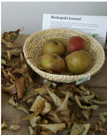
Jabolko bi lahko postalo zaščitni znak Jablaniške doline