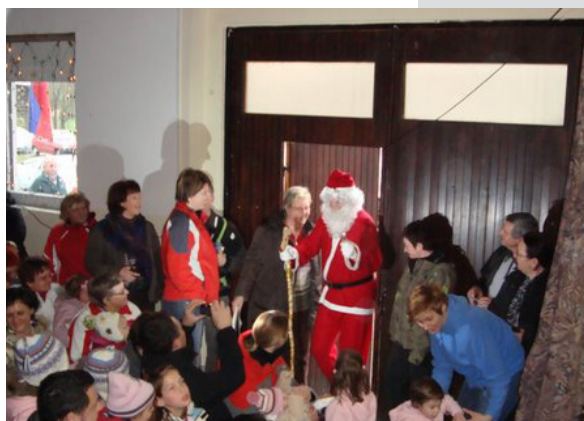
FOTO UTRINKI IZ ŠTEFANOVEGA SREČANJA