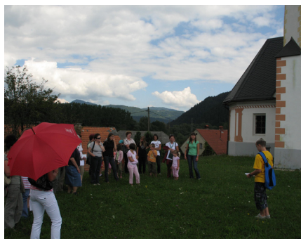
Obiskovalci na Bregu